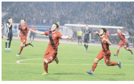
В Красноярске ЦСКА рассчитывал победить малой кровью, оставив в Москве 10 (!) игроков основного состава

Действующий чемпион страны ЦСКА вылетел из Кубка России, уступив в Красноярске «Енисею»