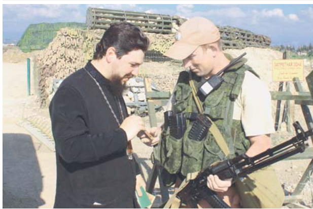
Российская авиационная группировка в Сирии за свою годовую историю увидела много восставших и обветшавших домов, известных музыкантов и художников, любимых артистов. Но такой предостерегающий десант из священнослужителей Русской православной церкви в Хмеймиме впервые. Чтобы подробнее выяснить цель их прибытия на многоотрадную сирийскую землю, специальный корреспондент «Красной звезды» в течение нескольких дней находился рядом с ними и убедился, что церковное служение во многом схоже с воинским.