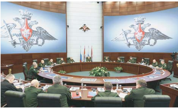
На СКШУ «Кавказ-2016» особое внимание уделялось созданию условий, максимально приближенных к реальной боевой обстановке

Выясно, чтобы и в дальнейшем около 4 тысяч котельных и 70 тысяч километров инженерных сетей работали без перебоев, а свыше 85 тысяч объектов казарменно-жилищного фонда были в полном объёме обеспечены теплом и светом, — поставил задачу генерал армии Сергей Шойгу и сообщил, что в этих целях в 2016 году начата реализация пилотного проекта модернизации теплового хозяйства в рамках концессионных соглашений.