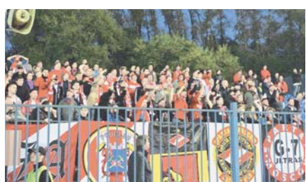
Вне всяких сомнений, столичный коллектив — самый популярный футбольный клуб России. Огромное количество его почитателей рассеяно по всей территории нашей страны...

Почему очередной конфуз «Спартак» не вызвал удивления у болельщиков клуба