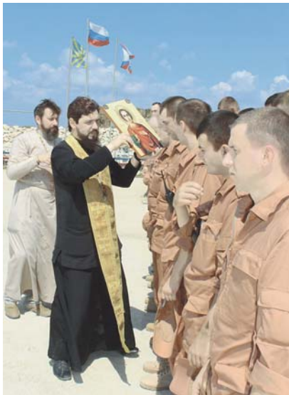
На следующий день был совершён крестный ход с иконой святого Георгия Победоносца вокруг авиабазы с проведением молебнов в подразделениях, охраняющих территорию аэродро-

Теперь помимо сторожевых постов и технических средств охраны авиационную группировку нежно оберегает святой Георгий, вселяя уверенность в сердцах воинов.