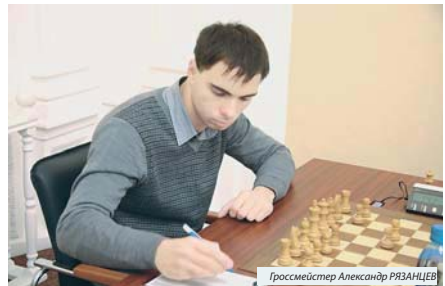
Гроссмейстер Александр РЫЗАНОВ

«Полагаю, что чемпион России — 2014 Игорь Лысый в труднейшей борьбе выиграл у Евгения Г. Попова». «Игорь Лысый мог начать пешечную атаку на королевском фланге. Очень ждём очередных заданий. Е. Емельянов». Как в ладнейном энциклопедии чемпиона России — 2014 сыграл против чемпиона Европы — 2015? Такой вопрос читателям «Каптерка» поставила 22 июля. В тот день на диаграмме задания № 569 была позиция из партии Игорь Лысый — Евгений Наер, сыгранной в Сочи в командном чемпионате России. Игорь так играл в ладнейном энциклопедии: 46. h4 Лa6 47. g5 Лa3+ 48. Крf4 Лh3 49. b4 Лh4+ 50. Крe5. и на 54-ю ходу чемпион Европы — 2015 поздравил чемпиона России — 2014 с победой.