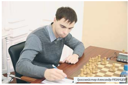
Гроссмейстер Александр РЯЗАНЦЕВ

«Полагаю, что чемпион России — 2014 Игорь Лысый в трудном задании выиграл 1, 14. Г. Попов».