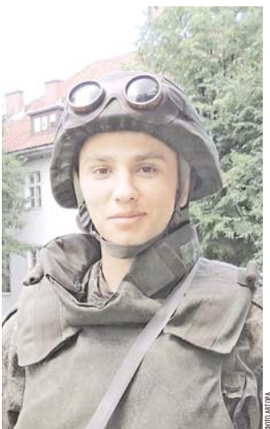
Призван 10 ноября 2015 года из города Тольятти Самарской области. Вышел младшим сержантом. Командир отделения зенитной ракетной батареи 22-го отдельного свардского зенитного ракетного полка (Валтийский флот).