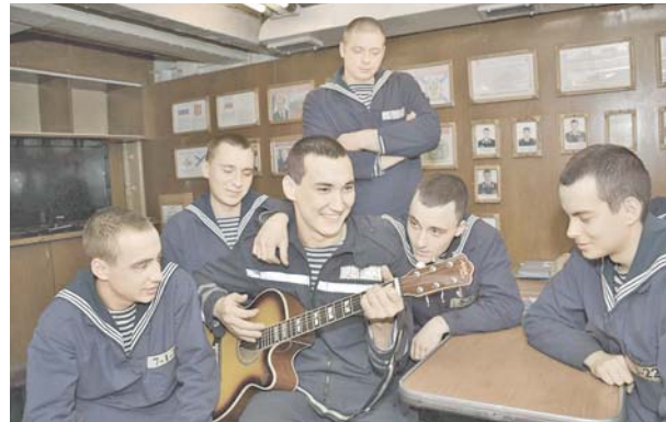
Гвардейцы в часы досуга

Успешно решает учебно-боевые задачи экипаж гвардейского ракетного крейсера