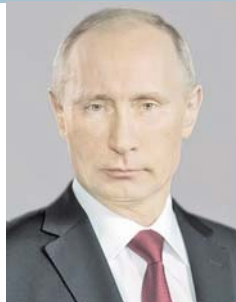
Президент России Владимир ПУТИН

В уходящем году было много событий, но самым значимым, безусловно, было 70-летие Победы нашего народа в Великой Отечественной войне. Мы отмечаем эту священную дату с преклонением перед старшим поколением, перед нашими отцами и дедом. Судьба поколения победителей вдохновляет нас и сегодня. Такие искренние чувства к Родине наполняют нашу жизнь высоким смыслом.