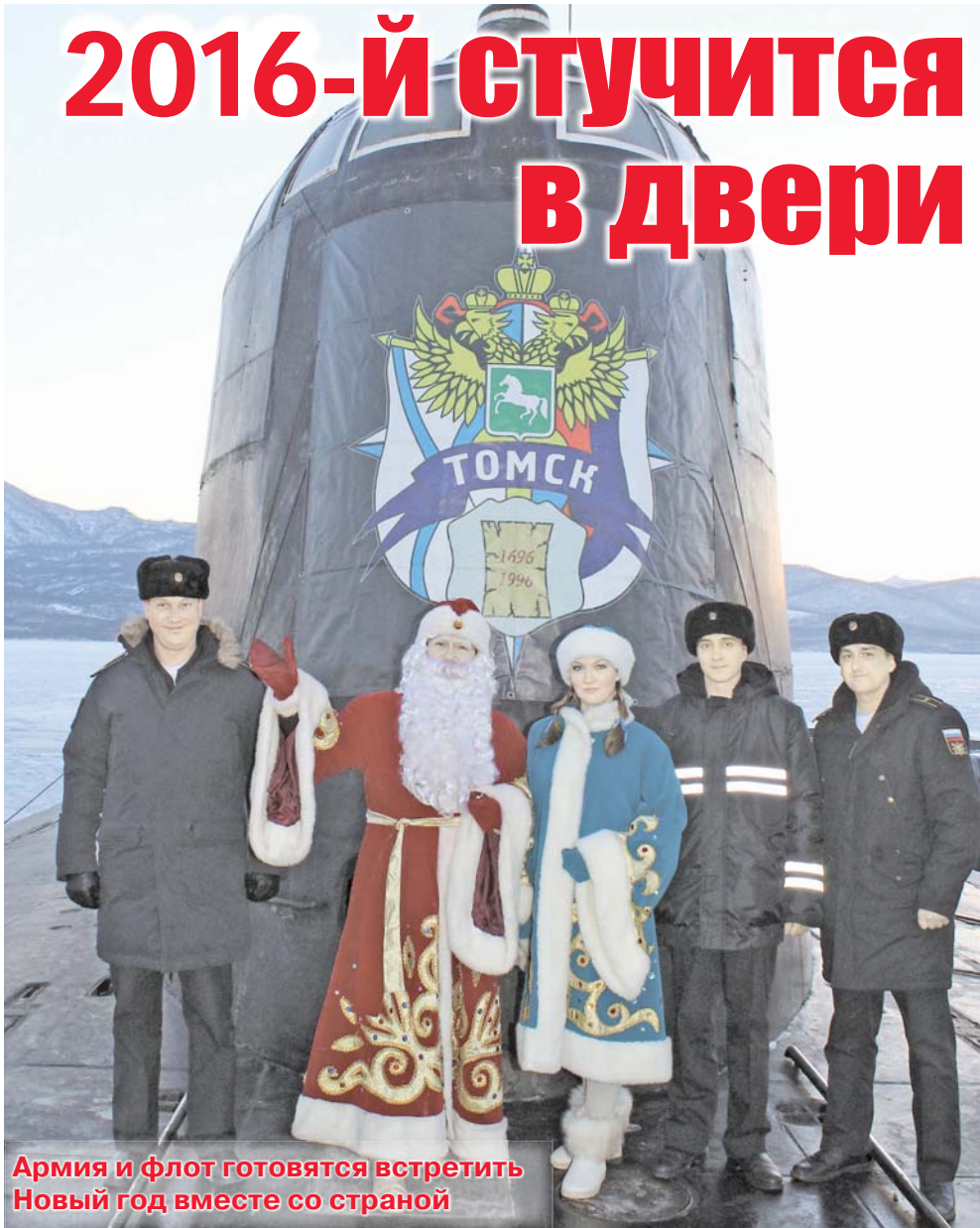
Армия и флот готовятся встретить Новый год вместе со страной

Министр обороны Российской Федерации генерал армии Сергей ШОЙГУ: