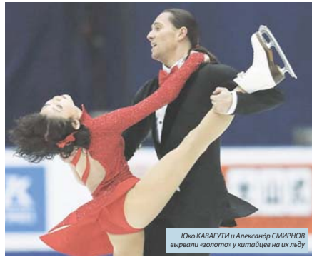
Юлю КАВАГУТИ и Александр СМИРНОВ выжирали «золото» у китайцев на их льду

Третий этап серии Гран-при по фигурному катанию прошёл в минувшие выходные в Пекине