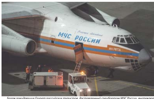
База покидающих Египет российских туристов, доставлены снегоботом МЧС России, выгружают из самолёта Ил-76 в терминале А аэропорта Внуково в Москве