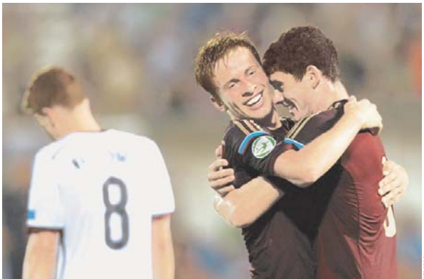
За дебютами об отставке Фабио Капелло на второй план ушли новости из Греции. Нет, не о событиях в стране после сдвига с Эриксеном — а эти дни там заканчивается чемпионат Европы по футболу среди игроков до 19 лет. Сборная России вечером в четверг (уже после подписания номера в печать) встретилась с хозяевами чемпионата — греками в подлужнице...

Юношеская сборная России по футболу (до 19 лет), выйдя в полуфинал чемпионата Евро, развенчала миф об отсутствии в стране перспективной молодёжи