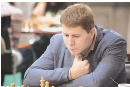
Чемпион России — 2001 и Европы-2014 гроссмейстер Александр МОТЫЛЁВ

«Третий призёр 11-го чемпионата СССР (1939 г.) Сергей Безаевенев, скорее всего, захватил вертикаль d — 1. Jd1. Никто не забит, ничто не забыто. Г. Попов». «Хорошо, что вы опубликовали