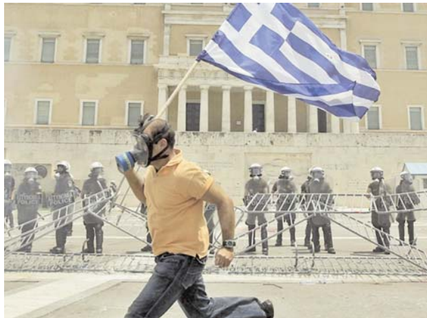
Массовые беспорядки произошли в центре Афин вблизи парламента. Противники жестких мер экономии, навязанных правительством Евросоюза, начали бросать бутылки с «коктейлями Молотова». В ответ полиция применила слезоточивый газ и светошумовые гранаты.

Евросоюз навязал Греции новые меры «евроэкономии»