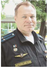
Лётчик-снайпер подполковник Рахимзян ИСРАФИЛОВ

Нынешнему почерку тихоокеанской авиации присущ упор на боевую подготовку, эффектив-