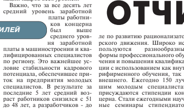
ЮБИЛЕИ Юбилей 10-летия создания предприятия отмечали работники ОНПП «Технология».

Важно, что за все десять лет средний уровень заработной платы работников вырос в среднем на 35 процентов, что в среднем составляет 60 тысяч рублей в месяц.