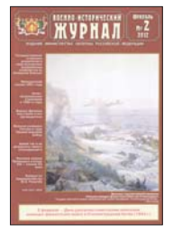
А. Самойла и биографический очерк о жизни и деятельности русского учёного академика М. Рыкачёва, основоположника морской метеорологии в России.

Под рубрикой «Локальные войны и вооружённые конфликты XX—XXI вв.» публикуются две статьи: «Государственное и военное управление в условиях военных конфликтов» и «Военно-исторический журнал» № 2. В рубрике «Военно-исторический журнал» № 2. В рубрике «Военно-исторический журнал» № 2.