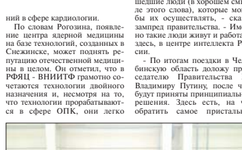
Леонид ХАЙРЕМДИНОВ, «Красная звезда». Фото автора.

Юрий Белоусов, - сказал зампред правительства. Именно такие люди живут и работают здесь, в центре интеллект России. По итогам поездки в Челябинскую область доклад представил Председателя РФ Владимир Путин, после чего будут приняты принципиальные решения. Здесь есть, на что обратить самое пристальное внимание, что поддержать и реализовать, - заключил Дмитрий Рогозин.