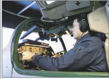
Как сообщили в Управлении пресс-службы и информации Министерства обороны РФ, летный состав ВВС активно проводит обучение на различных видах тренажеров...